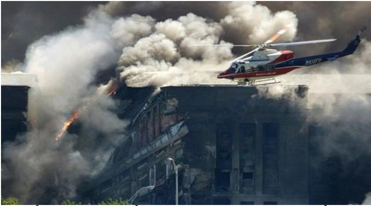
-Chiếc trực thăng cấp cứu khảo sát thiệt hại ở Lầu Năm Góc trong khi lính cứu hỏa chiến đấu với ngọn lửa-

), tiến lên chẳng được, bỏ ra đi cũng không xong như cái cảnh chiến tranh Iraq đã cho thấy... Tuần Báo TIME, tờ báo rất có giá trị, phát hành trong tháng 7 – 2006, đã gọi đó là cái “ Chính sách ngoại giao kiểu cao bồi – Cowboy Diplomacy “. Rồi cũng Báo Time, số ra ngày July 17, 2006, ngay ngoài bìa còn viết “ The End of Cowboy Diplomacy – What North Korea, Iraq and Iran teach us about the limits of going it alone – Sự chấm dứt của chính sách ngoại giao kiểu cao bồi- Bắc Hàn, Iraq và Iran đã dạy chúng ta những gì về cái lần ranh giới hạn để theo đuổi con đường đó một mình. “ Chẳng qua là do chủ quan, quá tự tin, cứ nghĩ rằng có sức mạnh vượt trội về vũ khí, hỏa lực chiến tranh ( Superiority of firepower ) đánh chiếm được Thủ Đô của địch, kéo cổ mấy bức tượng của hung thần Saddam Hussein xuống cho đám dân phần nộ reo hò, cắm được lá cờ của ta lên đỉnh cao nhất Thủ Đô kể như là hoàn toàn chiến thắng., mọi sự đã xong... Sai lầm quá lớn ! Tướng Mỹ 4 sao, Tư Lệnh chiến trường, Tommy Frank đánh chiếm xong thủ đô Baghdad là xin giải ngũ, về hưu ngay lập tức vì Ông Tướng này biết rõ : về hưu là Tướng thắng trận oanh liệt, nhưng ở lại mà không có “ chiến lược bình định hữu hiệu – Effective strategy of pacification “ thì sa lầy là cái chắc vì sức kháng cự của địch về nhân lực, vũ khí, nhất là tinh thần tử đạo của tôn giáo vẫn còn đó, kể như hoàn toàn nguyên vẹn. Ấy là chưa kể sự tiếp viện từ các quốc gia Hồi Giáo lân cận như Iran và Syria chẳng hạn. Hình ảnh của cuộc chiến Iraq, cho