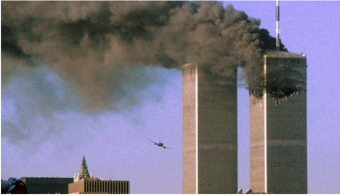
Chiếc máy bay của hãng United Airlines trước khi đâm vào tòa tháp phía nam của WTC

Toà Bạch Ốc , Trung Tâm Chỉ Huy quyền lực chính trị của Siêu cường quốc Hoa Kỳ đã thoát nạn trong gang tấc rồi đó. Vậy mà hậu quả do trận tấn công khủng bố này cũng đã không thể nào đo lường được. Trước hình ảnh đau thương, kinh hoàng và bất ngờ của trận tấn công khủng bố tàn bạo, dã man, mọi rợ, cố tâm đánh vào những người dân, không phân biệt già trẻ, phụ nữ, trẻ em, không có phương tiện tự vệ, cốt gây ra một tình trạng kinh hoàng khủng