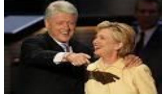
- Ông bà Bill và Hillary Clinton- 2008 -