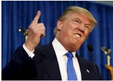
- Nhà tỉ phú Donald Trump -

Truyền hình, báo chí, báo in cũng như báo điện tử liên tục... tung bùng hoa lá cành bàn chuyện ...hình ảnh, màu sắc, âm thanh... cả mùi vị của cuộc tranh cử tổng thống Hoa kỳ 2016. Ở giai đoạn mở đầu, ta kêu là bầu cử sơ bộ ( primary election ). thật là không giống ai, chẳng theo ...sách vở nào hết trơn, xưa nay có thấy như rứa bao giờ đâu.