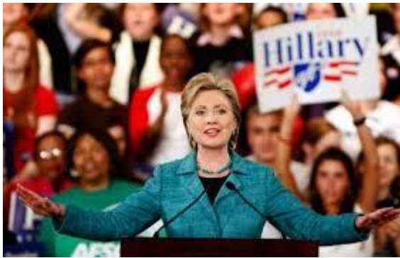
- Hillary Clinton năm 2008 -

Đáp ...lời sông núi, Bà Thượng Nghị Sĩ Bang New York Hillary Clinton , ứng cử viên Tổng Thống 2008 của Đảng Dân Chủ đã tung hoành trên “ trận địa tranh cử sơ bộ “ một cách vô cùng “ kiên cường, anh dũng “ có lúc gần như đi vào chỗ không có người, có lúc “ chạm địch “ cứ như súng đạn tung bùng ở Iraq. Người phụ nữ khôn ngoan, tài trí, mưu lược, nhiều kinh nghiệm trong lãnh vực chính trị rõ ràng là điều làm cho phái “ liên ông “ phe ta cũng như phe địch không thể nào coi thường được. Thời thế đã đến lúc “ Âm thịnh, Dương suy “ quá nặng mất rồi.