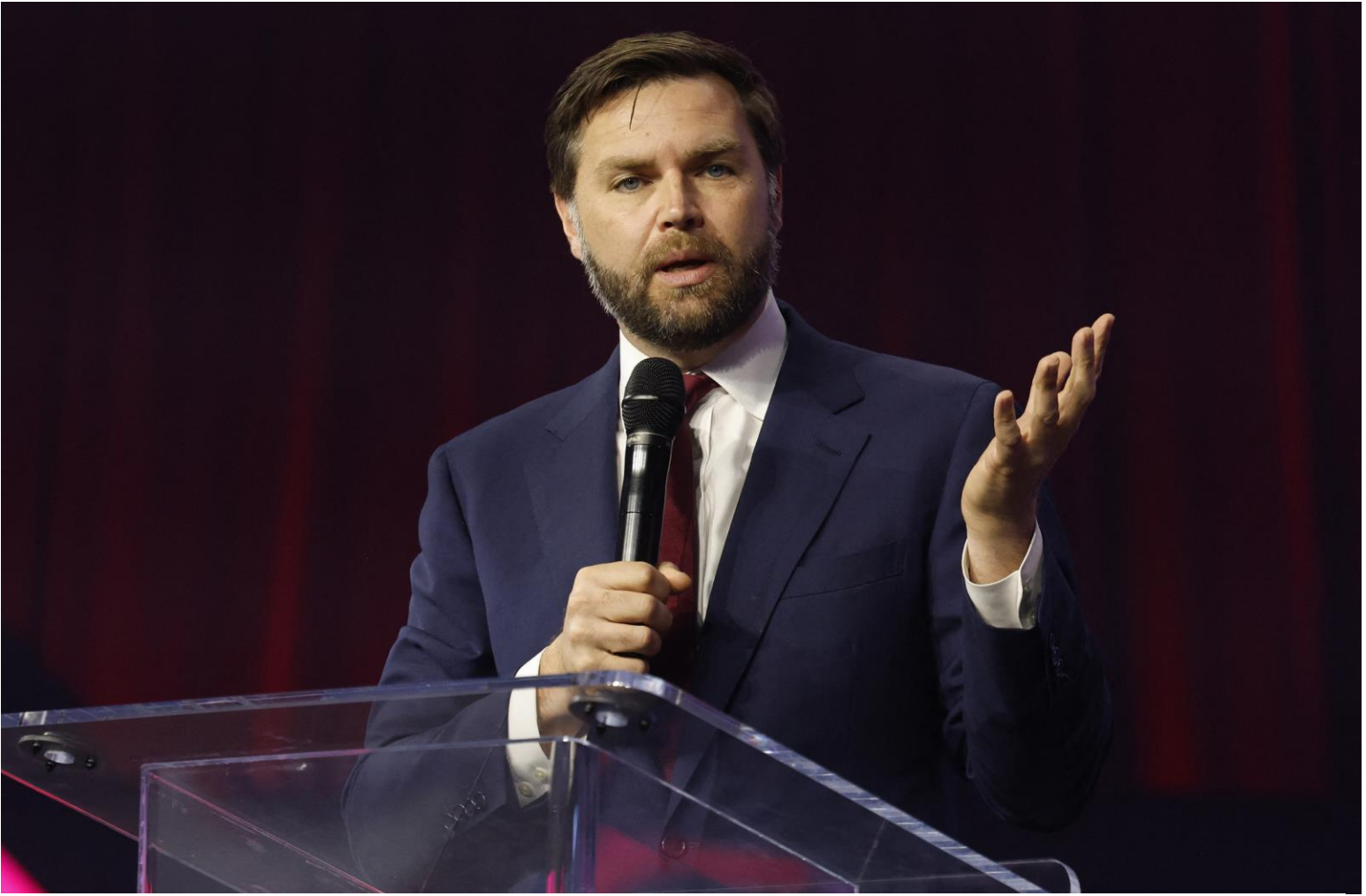
Thượng nghị sĩ bang Ohio J.D. Vance phát biểu tại Detroit, bang Michigan ngày 16/6.

Tổng thống Joe Biden mô tả ông Vance là "bản sao" của người tiền nhiệm đảng Cộng hòa. "Một bản sao của Trump trong mọi vấn đề. Tôi không thấy họ có điểm khác biệt", ông chủ Nhà Trắng trả lời báo giới khi được hỏi về thượng nghị sĩ Ohio.