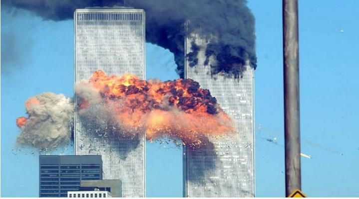
- Cận cảnh chiếc máy bay lao vào tòa tháp phía nam -