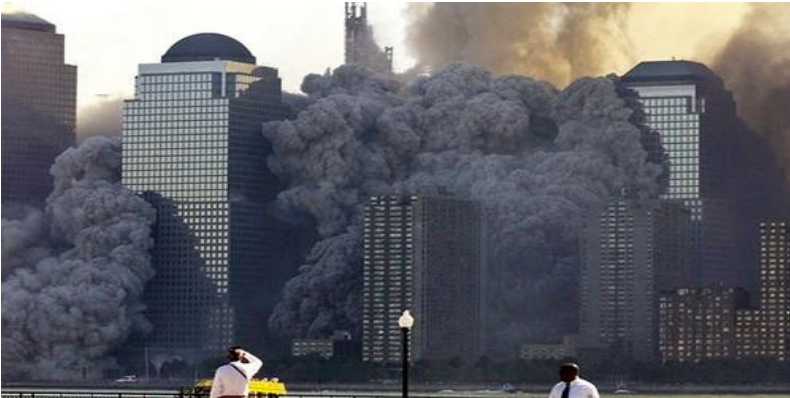
- Chiếc tháp phía tây đang sụp đổ -

Các Chiến lược gia ( Strategists ) của lực lượng khủng bố quốc tế đã đi một nước cờ táo bạo nhất. Họ đã chủ trương dùng phương tiện tàn bạo, dã man, vô cùng mọi rợ là cướp những chiếc máy bay chở đầy hành khách, rồi dùng những chiếc máy bay đầy người đó thay cho những chiếc hoả tiễn khổng lồ phóng vào