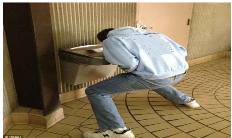
Rửa mặt là cả 1 sự cố gắng ...