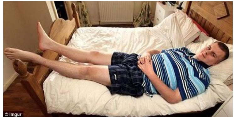
Có ...vấn đề với cái giường ngủ !