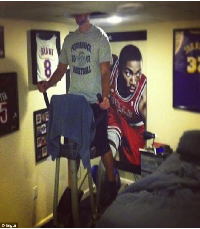
Để sử dụng được máy tập thể dục, phải như vậy...