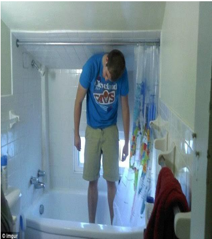
Chàng trai lún cần trong phòng tắm vì quá cao,