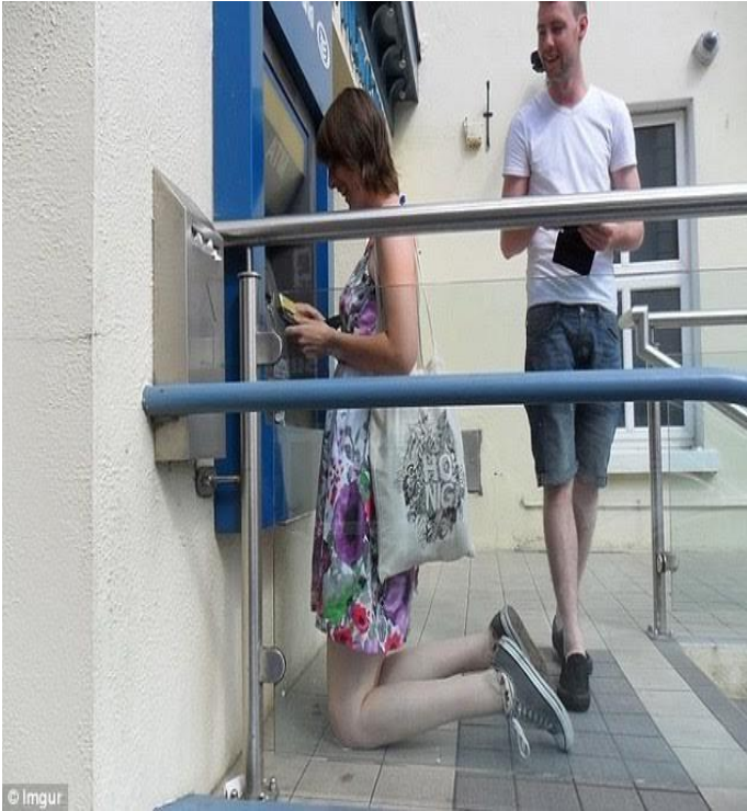
Vì cao quá nên cô gái phải quỳ khi rút tiền ở ATM