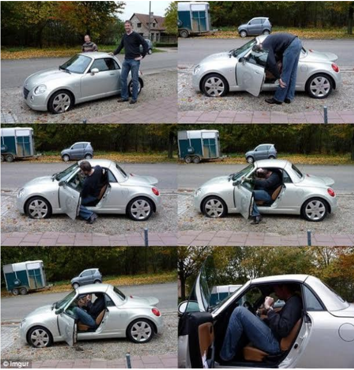
Chiếc xe trở thành tí hon đối với người quá cỡ.