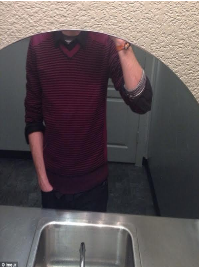
Cao quá, trở ngại nên được miễn...rửa chén.