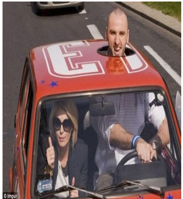
Để lái được xe hơi, chàng tài xế phải thế này...