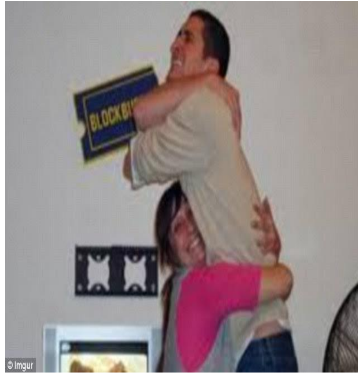
Mình đang ôm ai đây hè ?