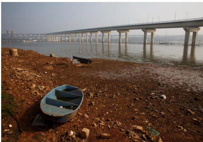
Cảnh sát Tàu đã bắt 1 người đàn ông dùng cái xuồng bé nhỏ này đi trốn...