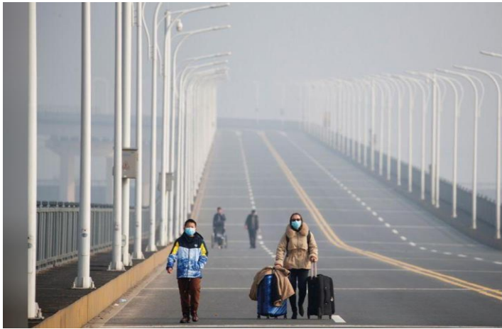
Qua cầu trên sông Dương Tử ...