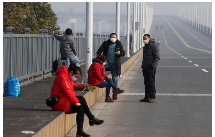
Rời Hồ Bắc vào tới đây là những người đã mua vé tới Giang Tây từ trước Tết Nguyên Đán...