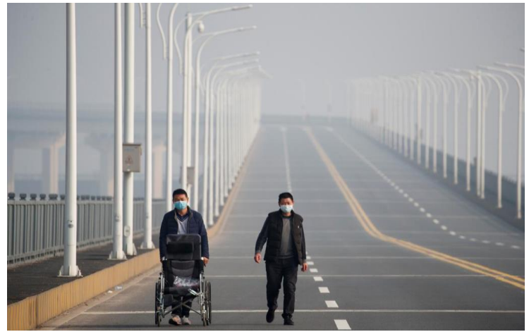
Chính quyền đã cấm các phương tiện giao thông công cộng qua cầu, ngoại trừ người đi bộ...