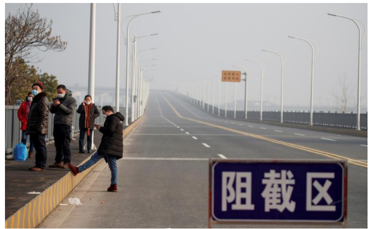
Đi bộ tới biển “ Cấm vào “ô điểm kiểm soát, trước khi vào thành phố Cửu Giang, Tỉnh Giang Tây.