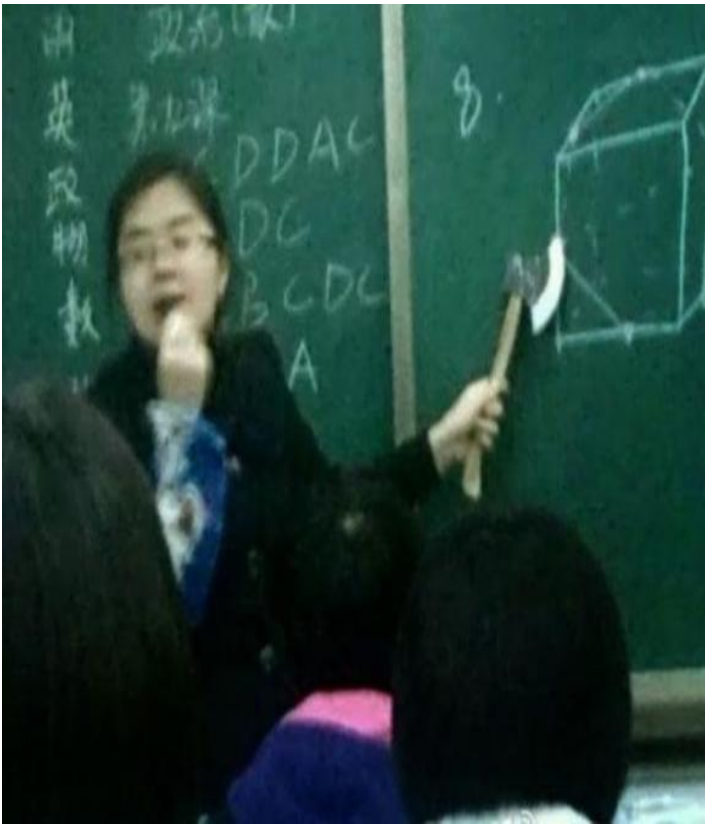
Chú ý vô ! Học không được là...ăn rìu đó !