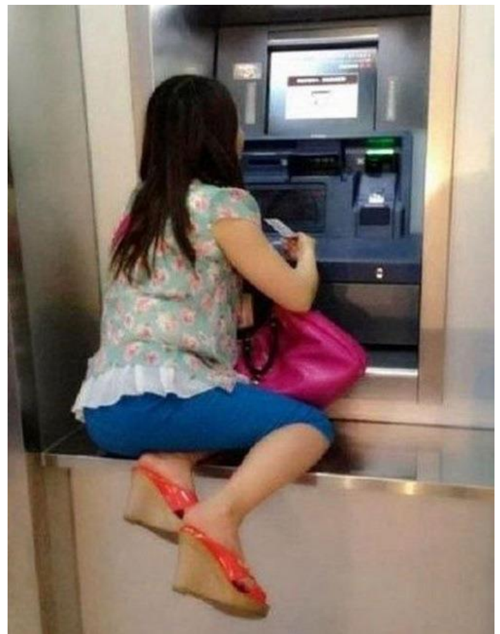
Mình lùn nên... khi rút tiền cũng hơi mệt !