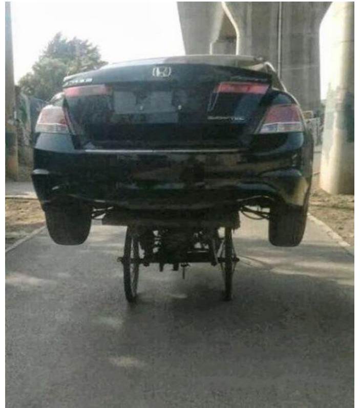
Xế hộp thể này mới oai !