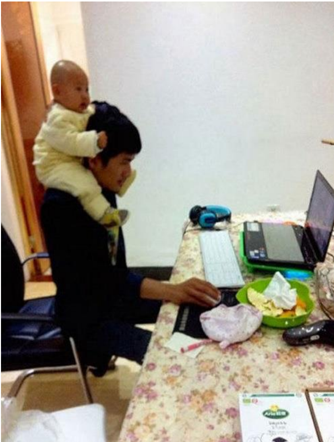
Coi con mà vẫn làm việc ngon lành ....