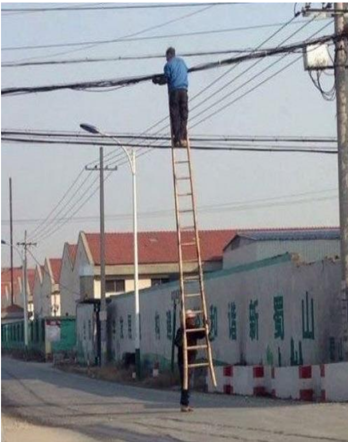
Thợ Tàu sửa điện, thợ Mỹ ngán chưa ?