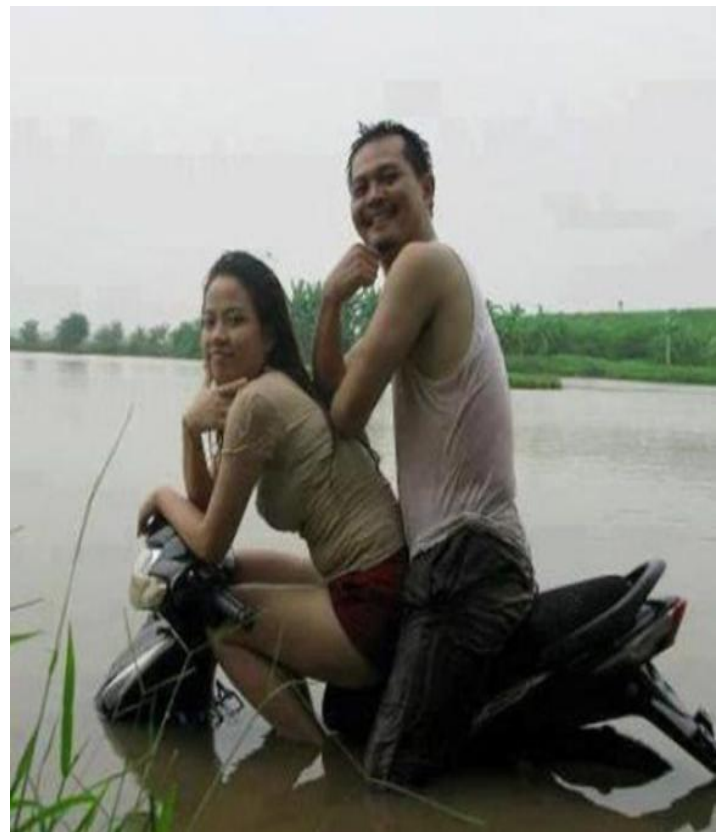
Mùa nước lũ, phe ta vẫn lãng mạn như thường ...