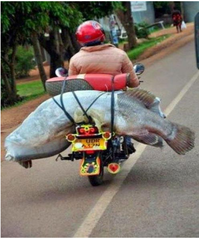
Bố khỉ ! Con cá to hơn cả cái xe !