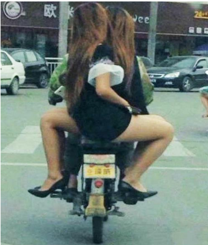
Tay lái xe ôm chổng văng khi quẹo trái hay phải...