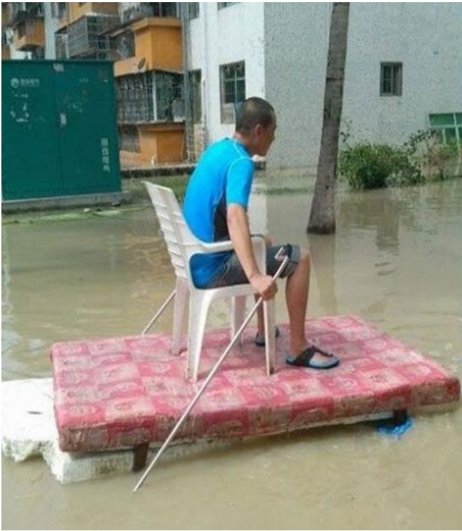
Óc sáng tạo của khoa học gia mùa mưa bão !