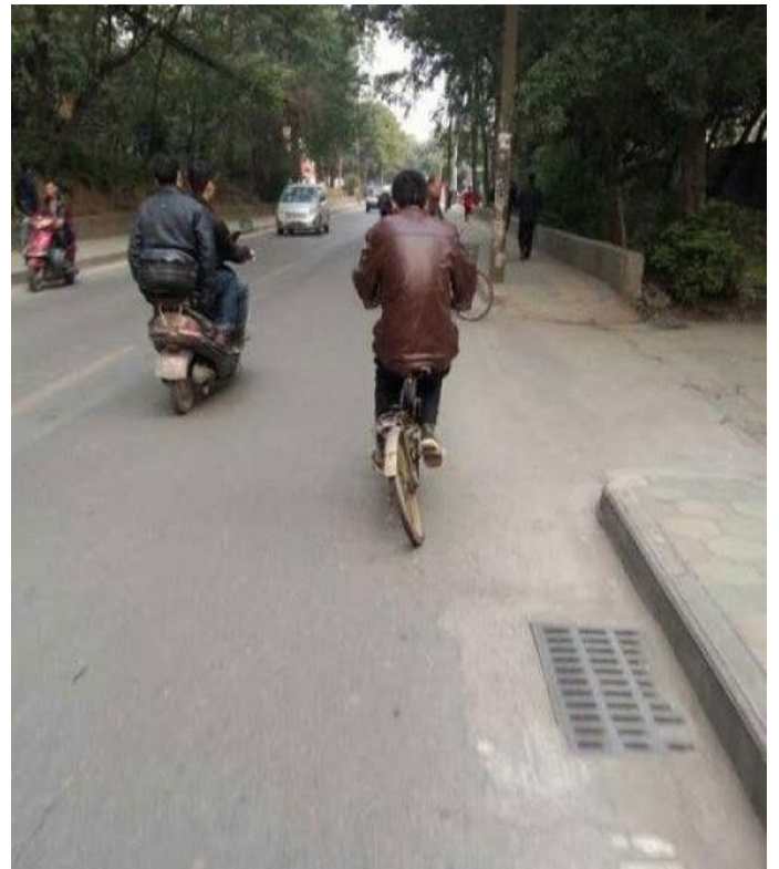
Bánh xe vênh xiên xẹo, ta vẫn chạy như thường !