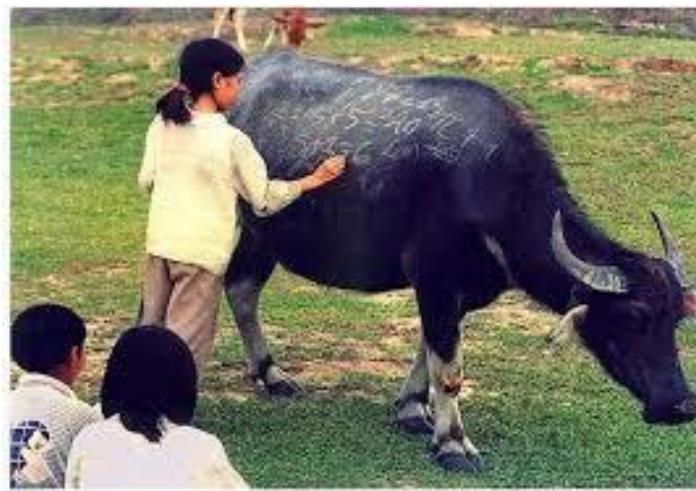
Tranh thủ thì giờ tập làm bài....