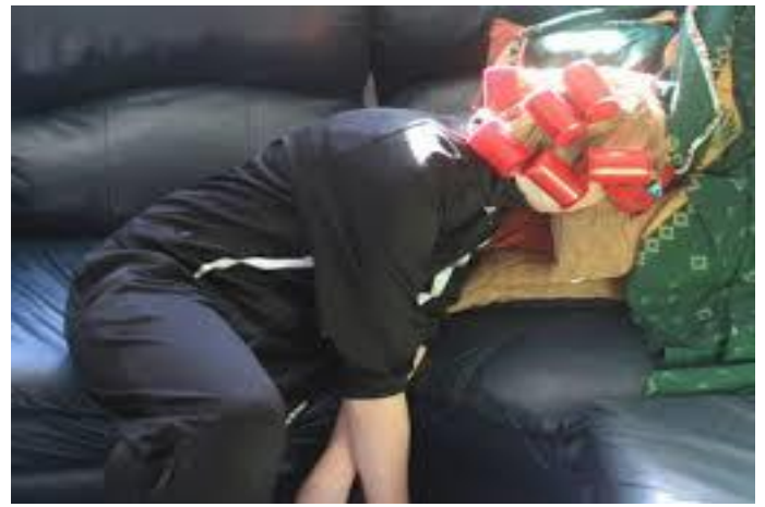
Bất cứ lúc nào cũng ngủ ngon lành !