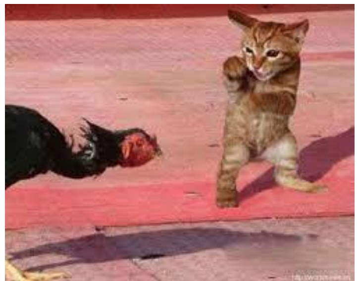
Mi có giới cứ nhào tới đi !