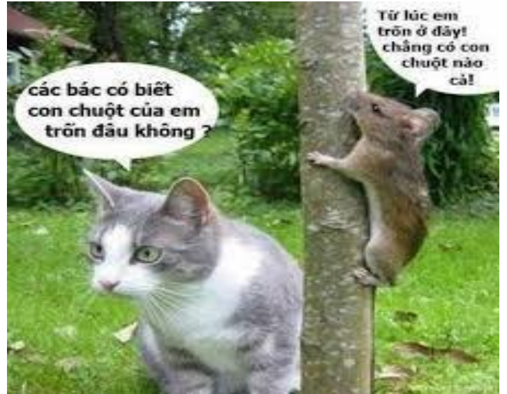
Con chuột biến đâu nhanh quá ta !