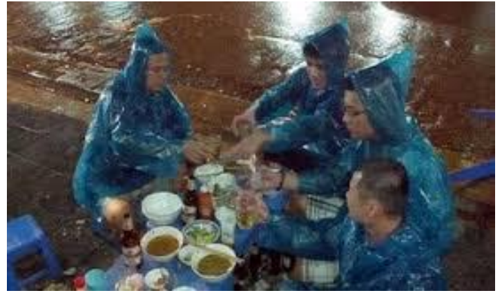
Nhậu trong hoàn cảnh nào cũng sống !