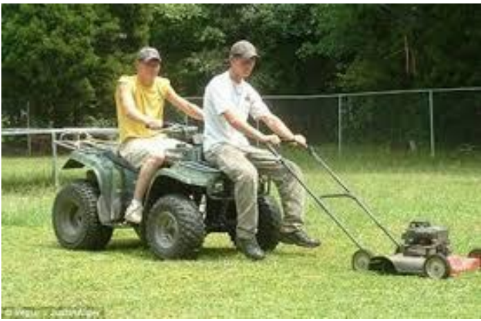
Cắt cỏ thế này có sướng không !