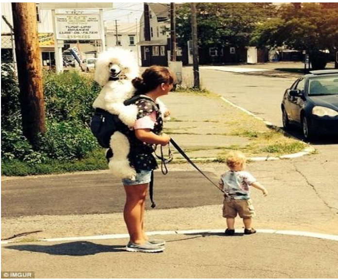
Mới coi 1 thằng Bé và con cún mà đã thấy cực rồi !