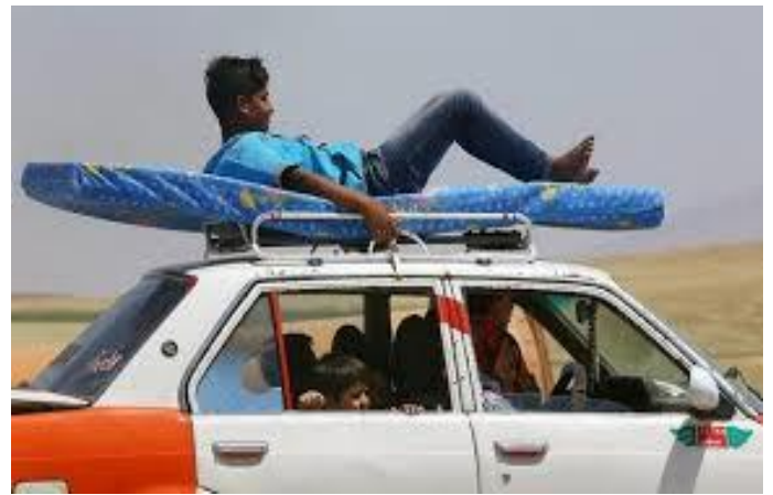
Xe hết chỗ ! Thế này không sướng à !