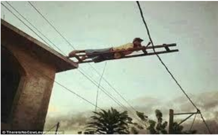
Kỹ thuật sửa chữa dây điện tân tiến.