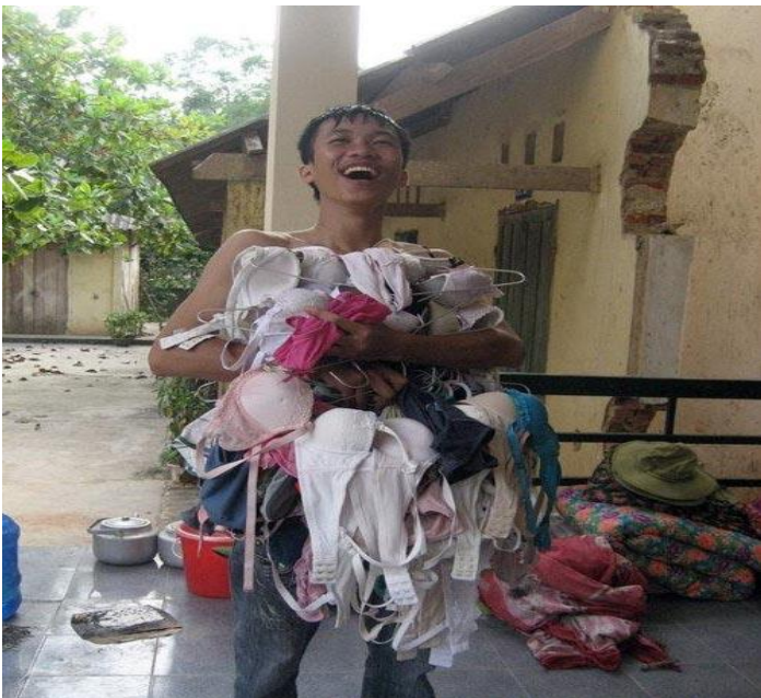
Mua sắm chi mà nhiều thế này, giặt không xuể !