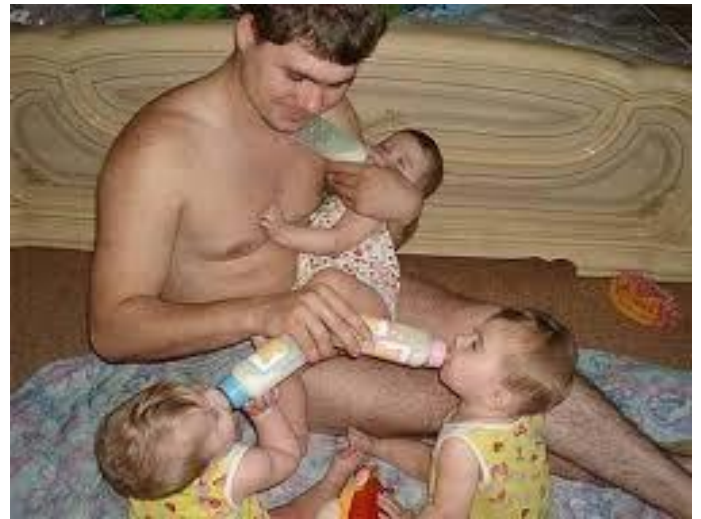
Ông Bố đã đoạt giải nhất về tài nuôi con