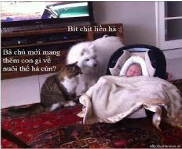
Bà chủ mới mang thêm con gì về nuôi thế này ?