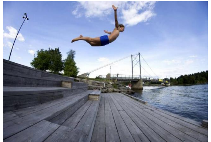
Anh chàng này chắc là...không ra chi !