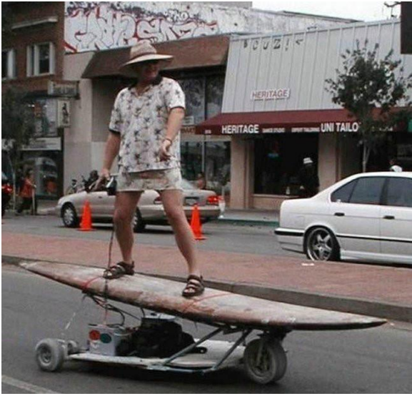
Không cần ra biển, ta vẫn lưới sóng được.