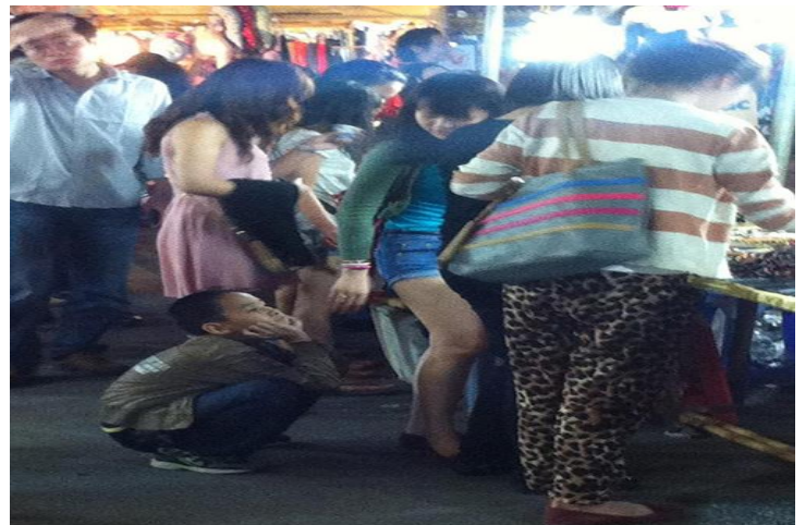
Trẻ con không có tội !