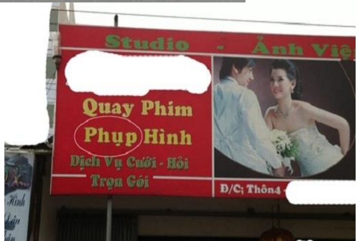
Cô dâu chú rể vào đây là để chụp ảnh cưới chứ ?