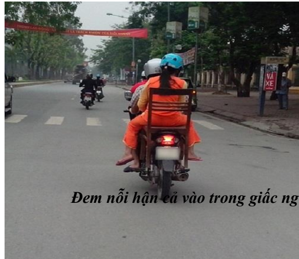
Đem nổi hận cả vào trong giấc ngủ.