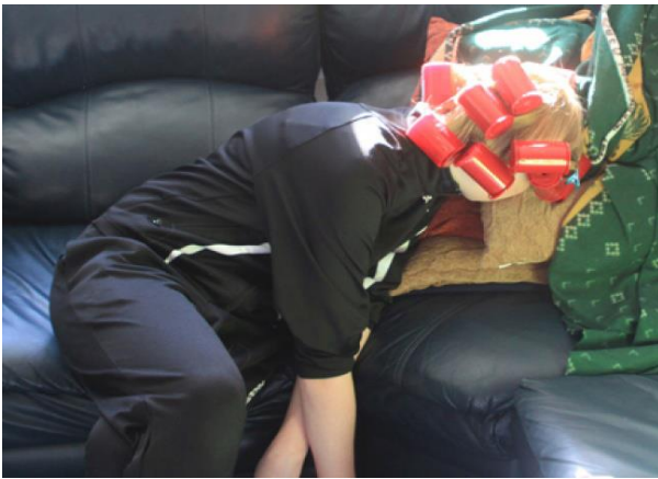
Thế này là khởi lo bị chụp trộm !