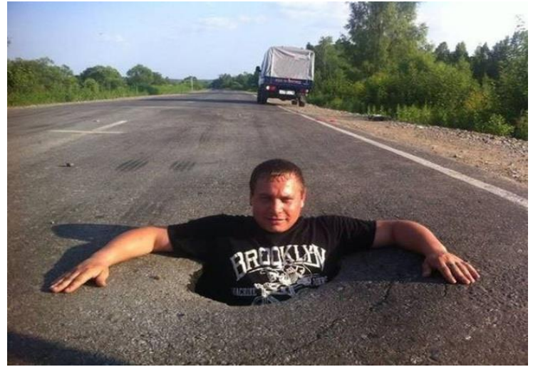
Cái hồ này chắc là để....lánh nạn đây !