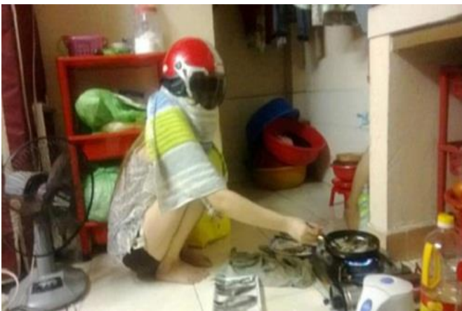
An toàn tuyệt đối trong lúc nấu ăn.