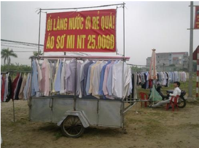
Thót cả tim với biển quảng cáo.