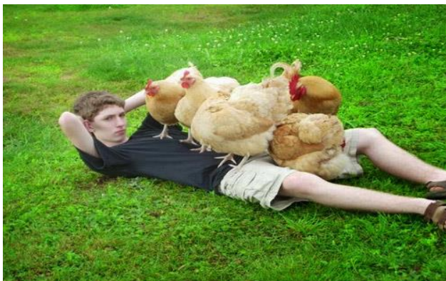
Tắm ảnh đẹp !