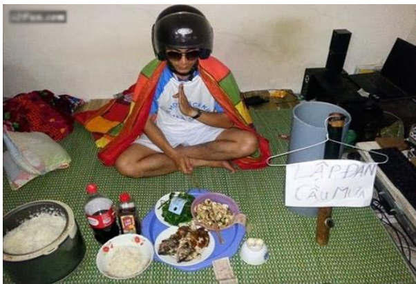
Lập đàn cúng quây