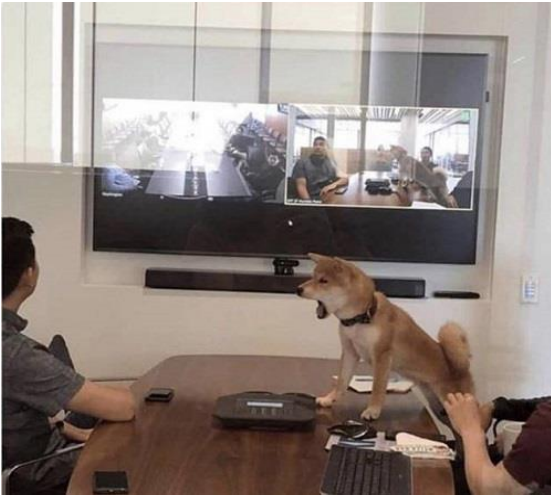
Khi Cún cưng nổi giận