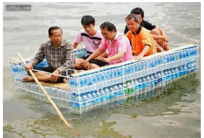
Du thuyền thứ xịn