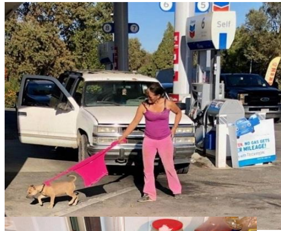
Đắt Cún dạo chơi mà quên mang dây xích.