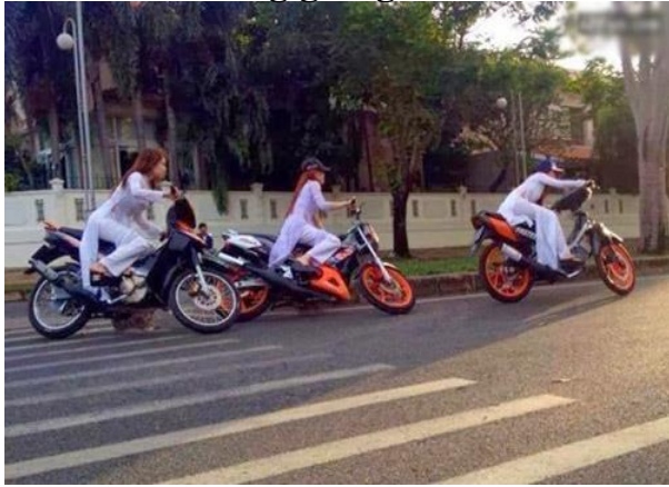
Phe áo dài quây 1 chút cho dzui