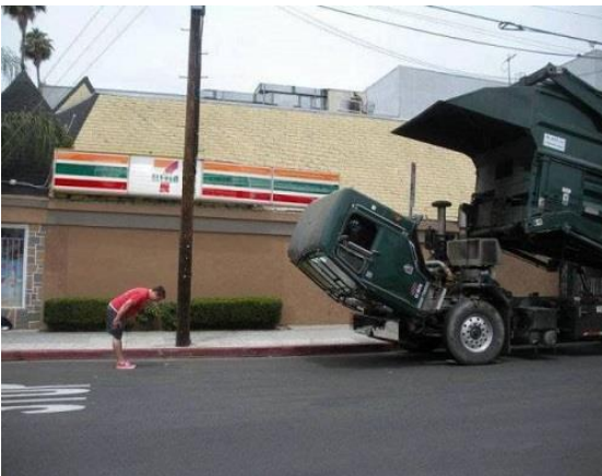
Cúi đầu chào lịch sự.