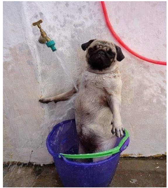
Tắm mát đã quá !