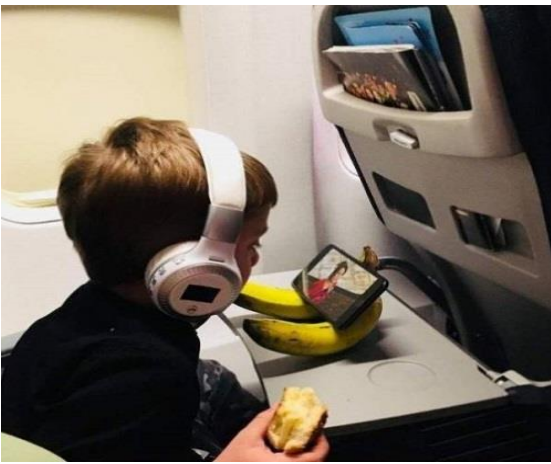
Mai sau chắc thành khoa học gia đáng nể !