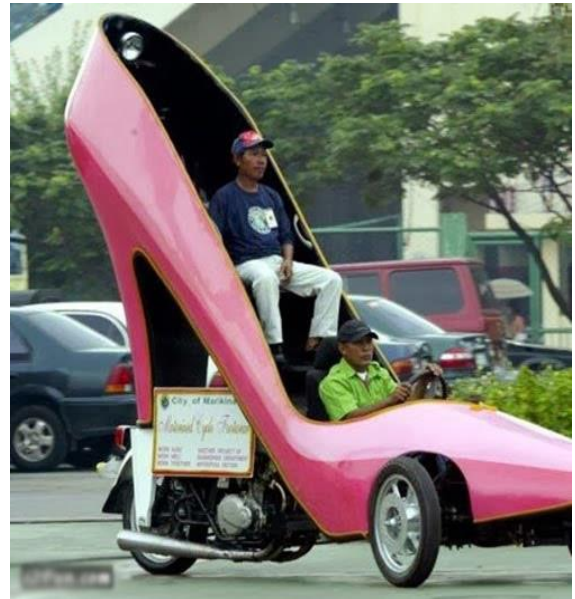
Xế xịn của đại gia