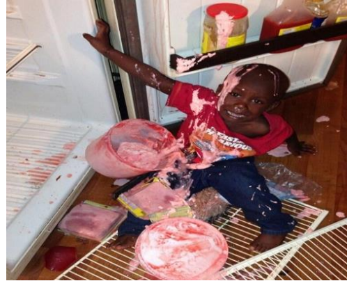
Quậy một tí cho vui ai ngờ...