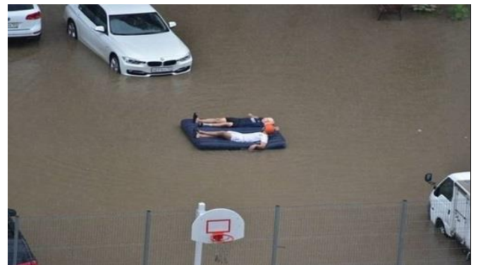
Dù nước ngập, ta vẫn thành thoi !