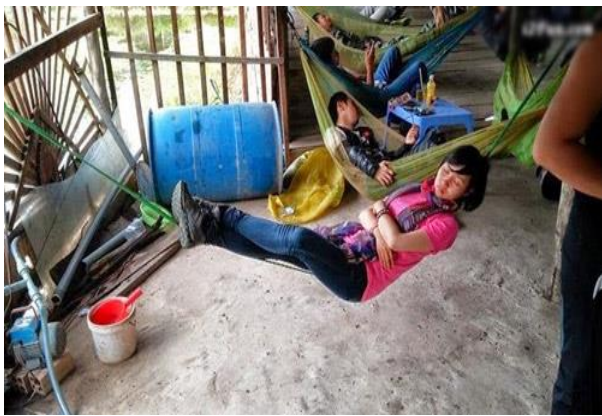
Ngủ ngon nơi quán trọ