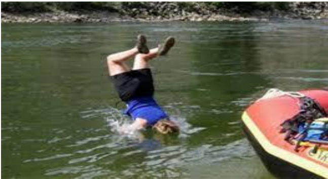
Ơ ! Đang nhậu, sao lại làm chi thế này !