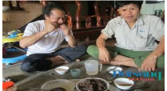
Dân nhậu mới thấy: gặm xương thật dã dõn !