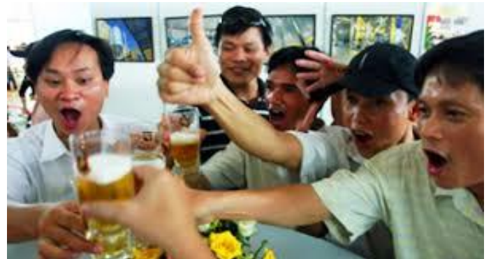
Chưa say là chưa có về đây nghe !