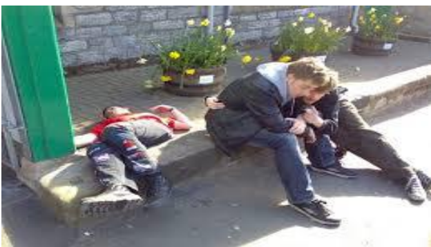
Ngủ thế này mời sướn, ai bằng...!