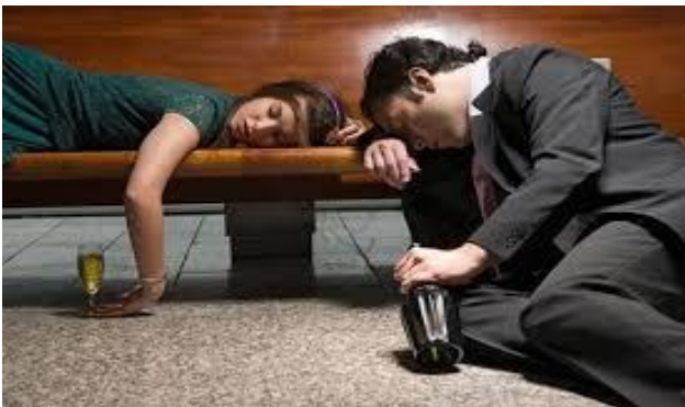
Đang Dzô ! Dzô ! Sao đã ngủ mất tiêu rồi !!!