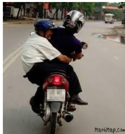
Hơi xin xìn, nhưng lái xe vẫn còn ngon !