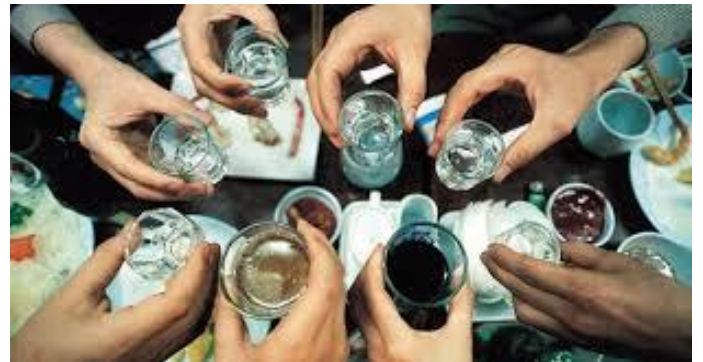
Lúc này đâu còn biết gì là chiến tranh !