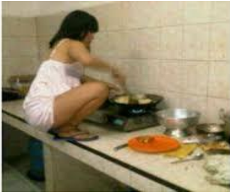
Gái khôn lựa mấy anh nhậu mà....nhờ....