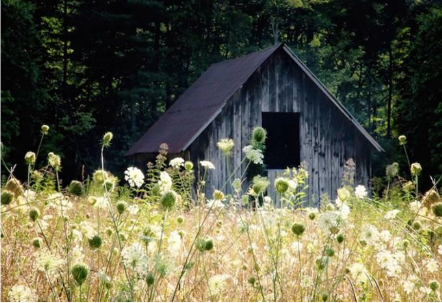
Một trang trại cũ gần Brevard, Mỹ.