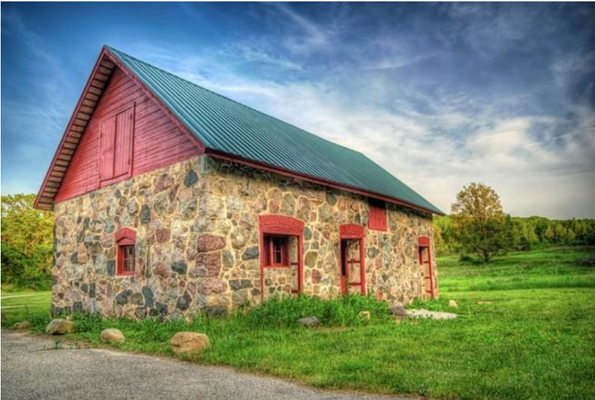
Trang trại cổ xưa này nằm ở gần khu đất cày trại trong công viên ở tiểu bang phía nam Kettle Moraine ở của Wisconsin.