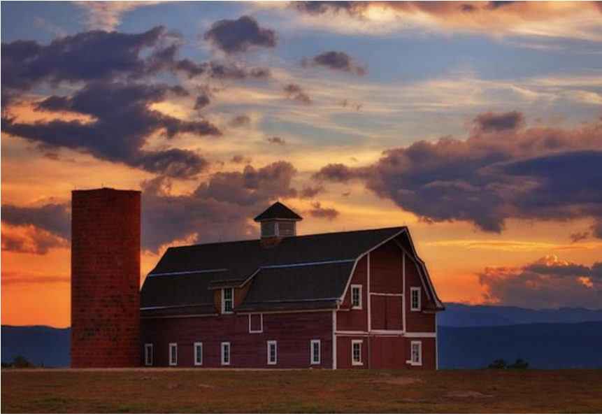
Hình ảnh một trang trại cổ điển màu đỏ dưới ánh nắng mặt trời lúc hoàng hôn gần Highlands Ranch, Colorado.