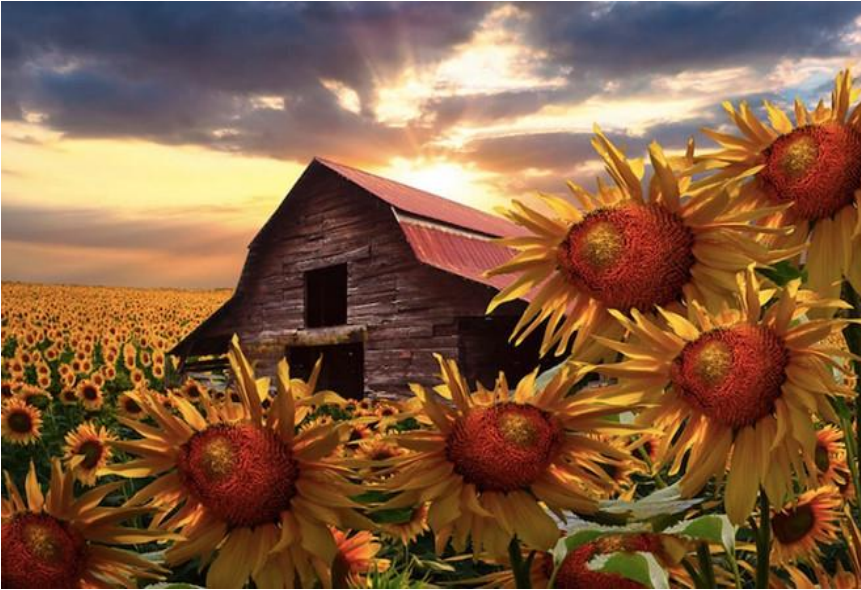
Trang trại nhỏ bé này nằm giữa một cánh đồng hoa hướng dương rộng lớn cùng với những tia nắng mặt trời len lõi qua những đám mây, chiếu xuống cánh đồng tạo ra một cảnh quan đầy mê hoặc và quyến rũ.