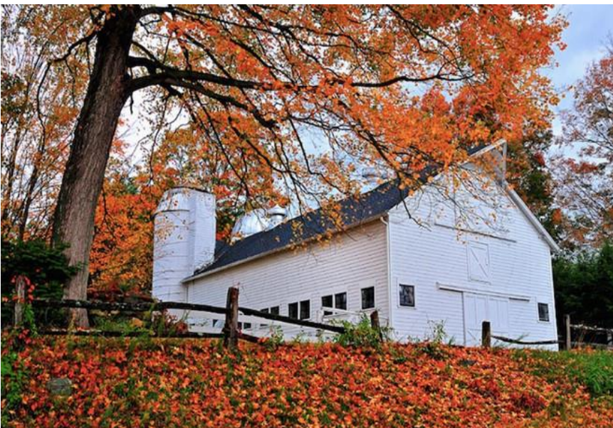
Trang trại này nằm trên đồi Litchfield. Ngôi nhà màu trắng này đã được bảo quản rất tốt. Màu trắng xen lẫn với những tán lá phong màu sắc rực rỡ vào mùa thu tô điểm thêm vẻ đẹp thôn quê thơ mộng.