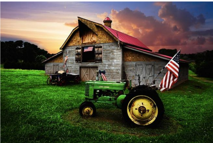
Một chiếc máy kéo cổ điển nằm ở phía trước của một trang trại cũ trên dãy núi Appalachian, phía Bắc Georgia, gần ranh giới tiểu bang North Carolina.