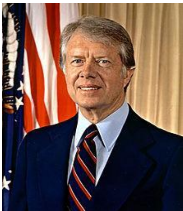
TT. James Earl Carter

Tổng Thống. Rõ ràng là Ông Gerald R. Ford đã lên làm Tổng Thống Hoa Kỳ . Kỳ theo một con đường chẳng giống ai cả trong suốt chiều dài của Lịch Sử nước Mỹ. Tuy rằng ngài Tổng Thống Ford này đẹp người, đẹp tướng, từng là Luật Sư, trong khi nước Mỹ tham dự vào cuộc Thế Chiến 2 thì Ông luật Sư Ford nhập ngũ, phục vụ trong ngành Hải Quân gần 4 năm trong vùng Nam Thái Bình Dương ( Ford's career as a lawyer was interrupted by World War II. Joining the Navy, he served for almost four years in the South Pacific...). Sau này Ông được bầu vào Hạ Viện liên tục 12 nhiệm kỳ. Về vang lấm chó bộ ! Thế nhưng Ông ở vị trí số 1 tại Tòa Bạch Ốc không phải 2 nhiệm kỳ, mà cũng chẳng phải 1 nhiệm kỳ trọn vẹn. Ông chỉ ở ngôi vị đó từ ngày 9 tháng 8 - 1974 ( vào lúc chiến tranh Việt Nam đang hồi bi thảm, quân đội Mỹ của Ông ra đi sau Hiệp Định Paris 1973 buồn như buổi chiều Thu mưa gió sục sùi ) tức là ngày ông Nixon khăn gói ra đi cũng buồn như kiểu đó cho đến ngày 20 tháng 1 - 1977, ông phải nhường