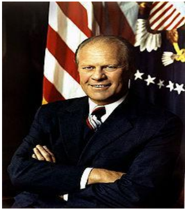
TT. Gerald Rudolph Ford

C.- Một người làm Tổng Thống bằng con đường chẳng giống ai : Ngài Nixon chọn ông Gerald Rudolph Ford, đang là Dân Biểu Hạ Viện, và xin Quốc Hội chấp thuận cho ông này làm Phó Tổng Thống thay ông Agnew đã ra đi. Quốc Hội, gồm cả Hạ Viện và Thượng Viện đều chấp thuận đề nghị này. Ông Ford đang là Dân Biểu Hạ Viện, nhảy lên làm Phó Tổng Thống. Lạ lùng chưa ! . Đó là chuyện của năm 1973. Thế rồi đến khi chính Ông Richard Nixon cũng phải từ chức Tổng Thống để ra đi vào năm 1974 thì Ông Ford, theo tinh thần Hiến Pháp, đương nhiên lên làm