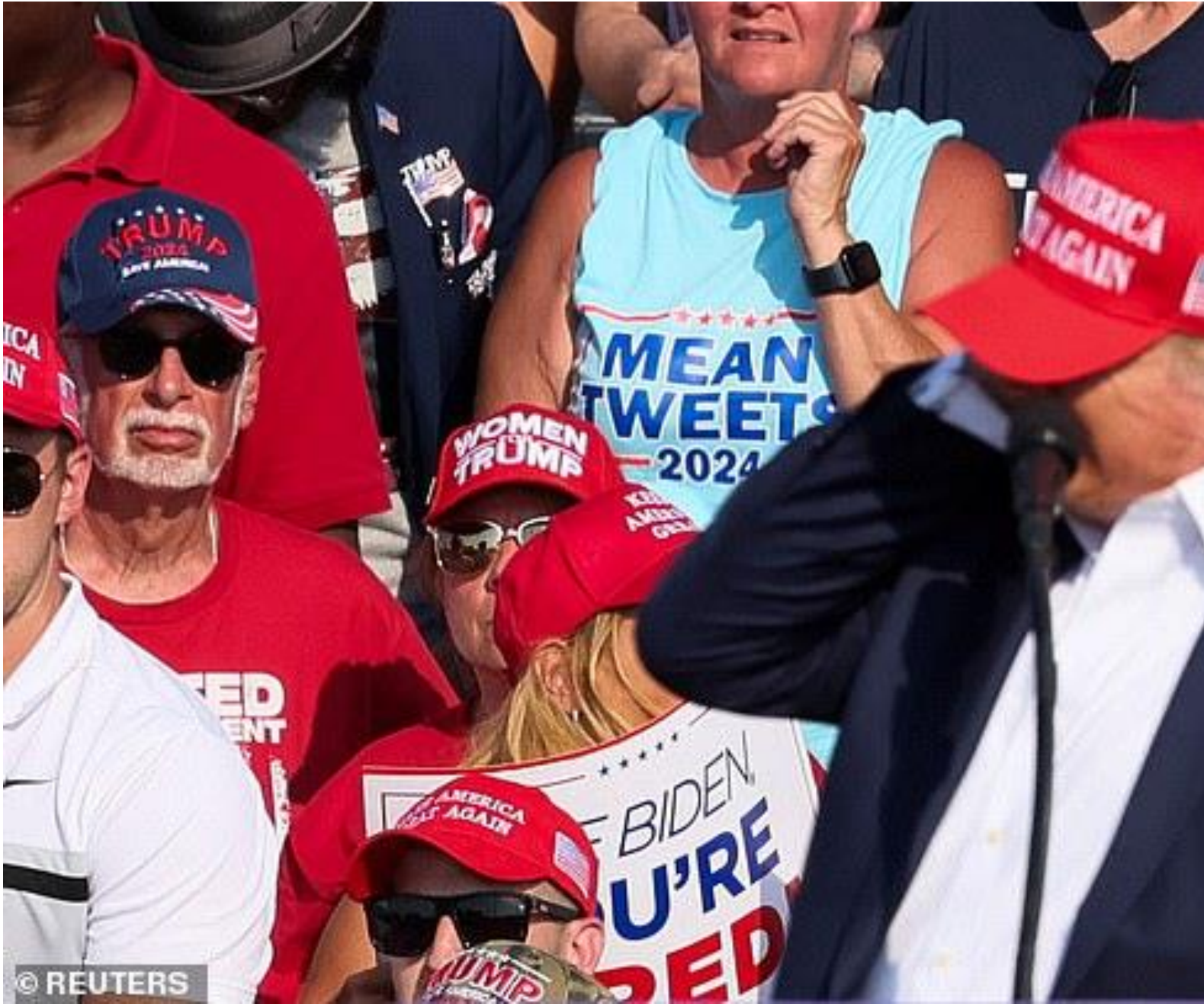
Trump phản ứng nhanh khi một số phát súng bay về phía ông tại cuộc biểu tình ở Pennsylvania