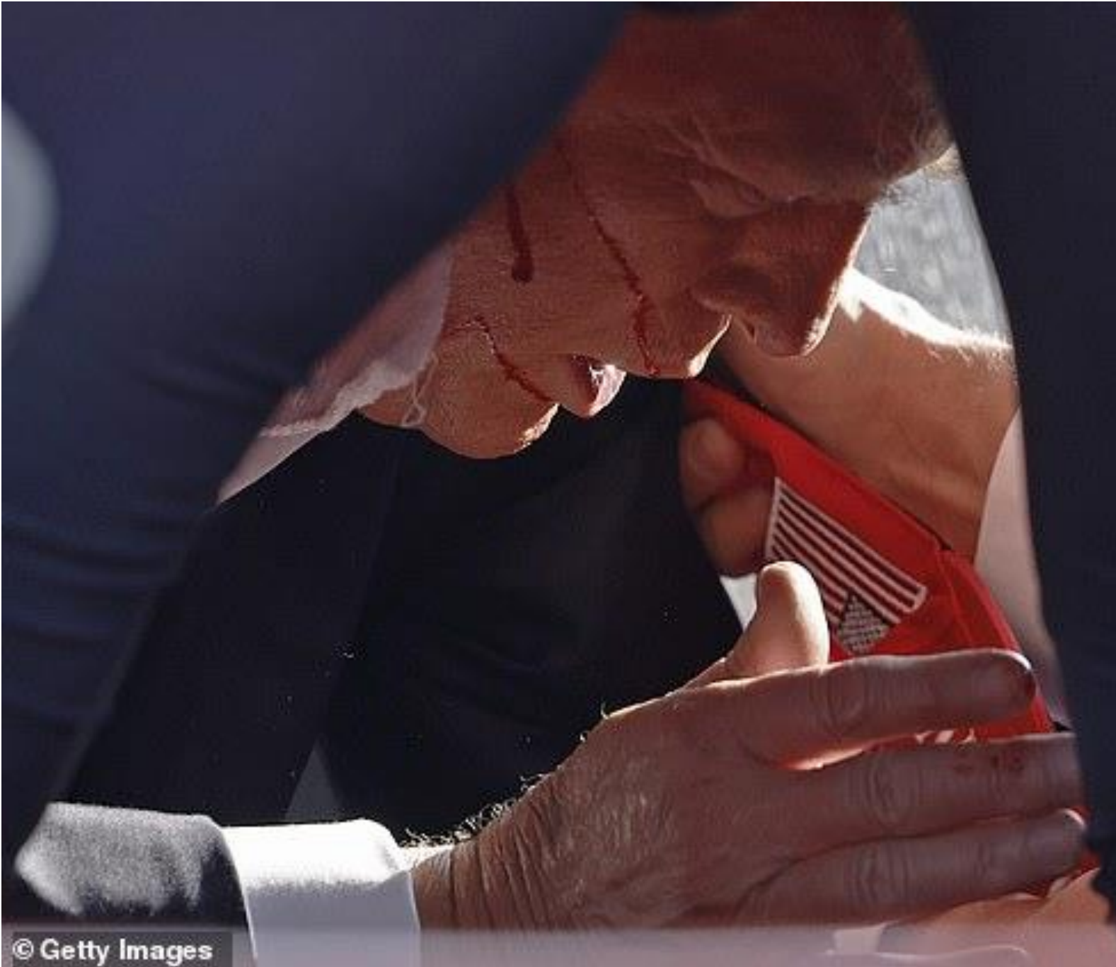
Trump đã chảy máu trên má khi các mật vụ đè ông xuống sàn.