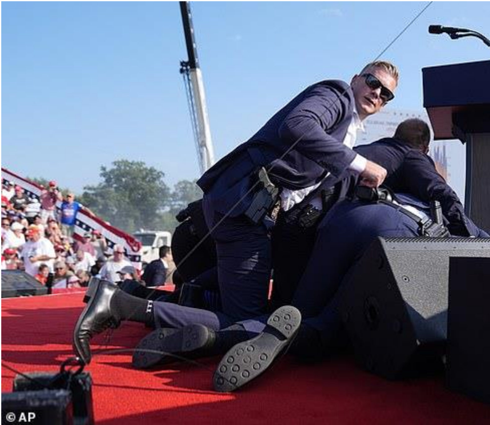
Mật vụ chạy lên sân khấu để bảo vệ Trump sau khi có tiếng súng nổ