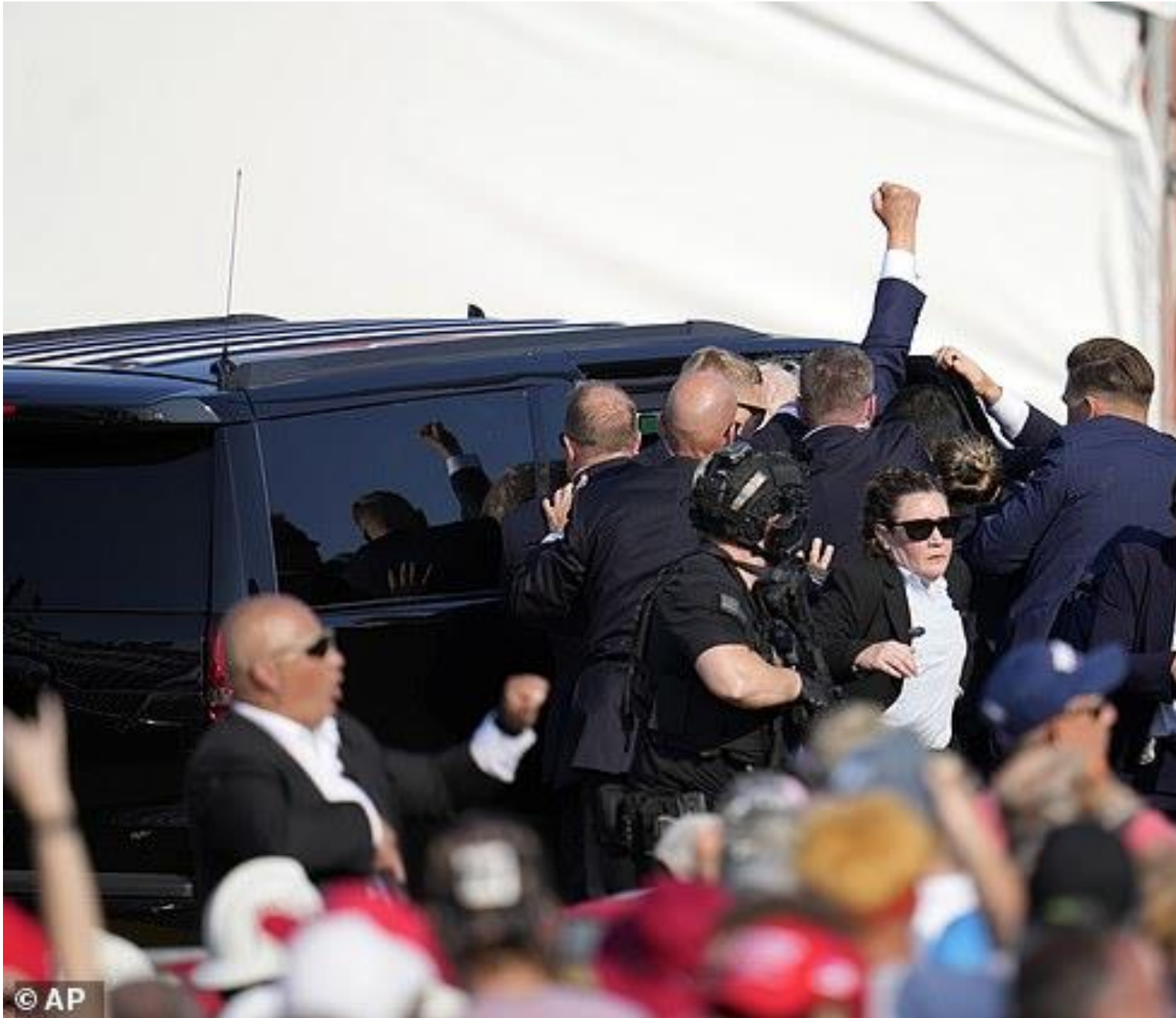
Khi bị đưa vào xe SUV, Trump lại giơ nắm tay về phía những người ủng hộ mình.