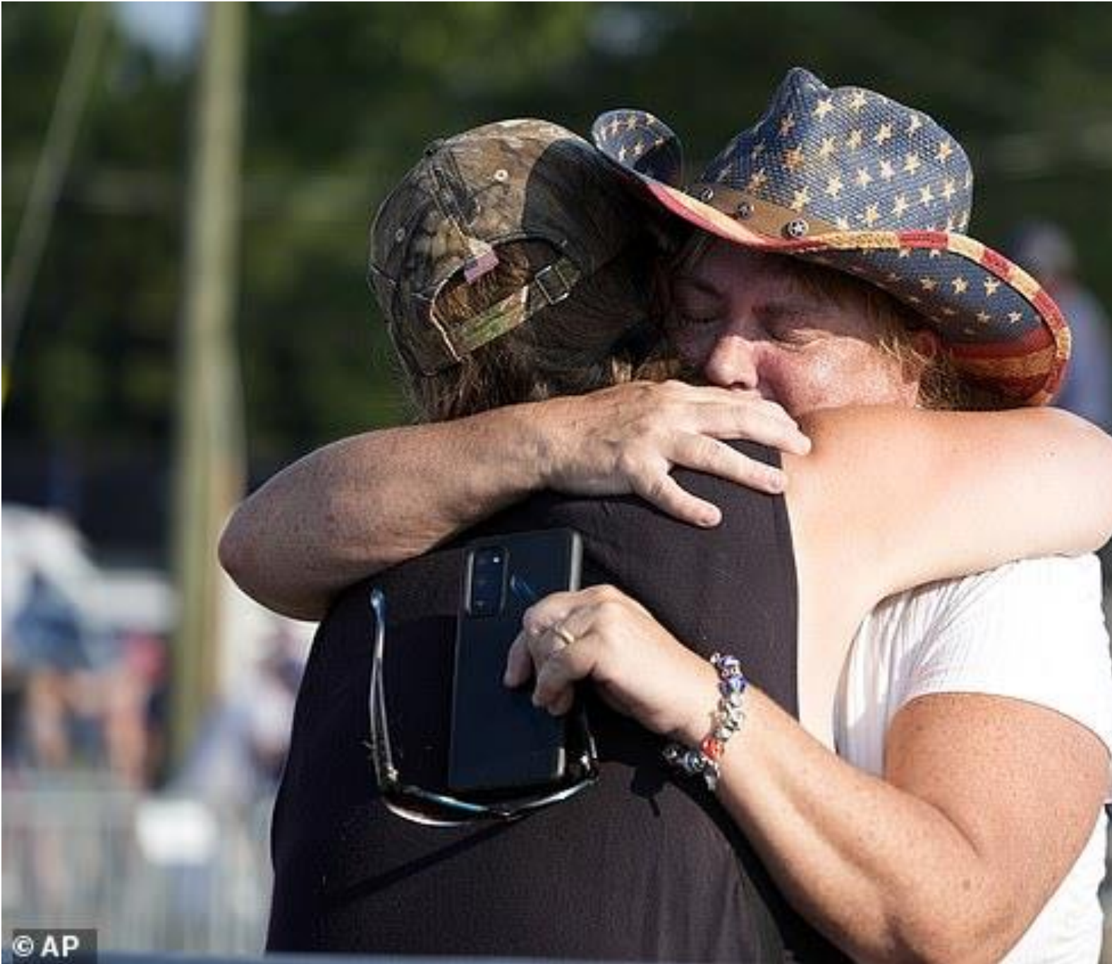
Nhân chúng ôm nhau sau khi chứng kiến vụ ám sát