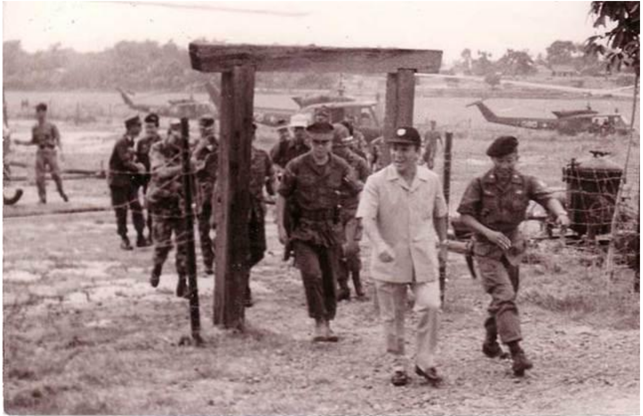
President Nguyen Van Thieu flew to Go Dau Ha to visit the troops after DUC HUE battle

Tổng-Thống Nguyễn-Văn-Thiệu đến Gò-Dầu-Hạ quan sát chiến-trường