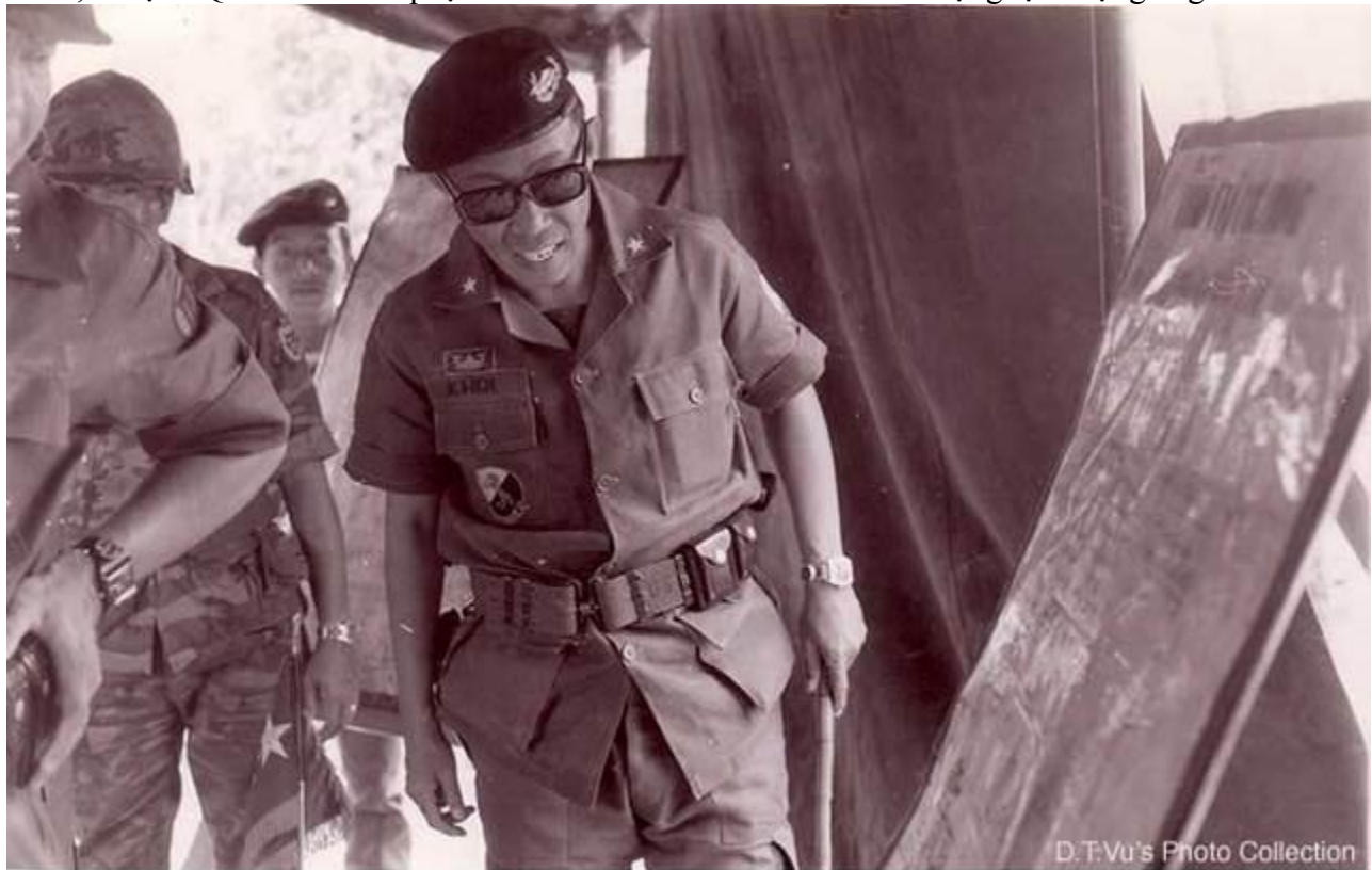
BRIGADIER GENERAL TRAN QUANG KHOI

Sau khi ký-kết Hiệp-Định Paris, đầu năm 1973, Quân-đội Mỹ ở Miền Nam Việt-Nam (MNVN) bắt đầu rút quân về nước. Các đơn-vị chủ-lực của CSVN ở Vùng 3 Chiến-Thuật gồm có 3 Sư-đoàn Bộ-binh: 5, 7, 9 và các đơn-vị đặc-công ém-quân bên kia biên-giới Việt-Miên thường-xuyên xâm-nhập vào lãnh-thổ nước ta quấy-nhiều hoặc bao-vây tấn-công các đồn biên-phòng của chúng ta dọc theo biên-giới ở các tỉnh Hậu-Nghĩa, Tây-Ninh, Bình-Long và Phước-Long. Chủ-lực của Quân-đoàn III gồm có 3 Sư-đoàn Bộ-Binh 5, 18, 25 và Lữ-đoàn 3 Ky-Binh được sự yểm-trợ trực-tiếp của Tiểu-đoàn 46 Pháo-binh 155 ly, Tiểu-đoàn 61 PB 105 ly và Liên-đoàn 30 Công-Binh dưới quyền chỉ-huy của trung-tướng Nguyễn-Văn-Minh, một mặt phải lo dàn mỏng quân ra thay-thế Lực-lượng II Dã-chiến Hoa-Kỳ để bảo-vệ lãnh-thổ chống lại chủ-trương “dành dân lấn đất” của Cộng-Sản sau khi Hiệp-Định Paris ra đời; mặt khác, trung-tướng Nguyễn-Văn-Minh, tư-lệnh Quân-Đoàn III phạm sai lầm rất lớn về tổ-chức và sử-dụng lực-lượng là giải-tán