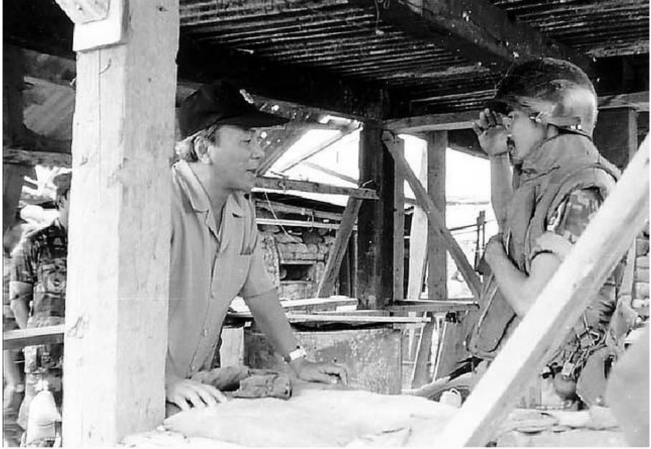
President Nguyen Van Thieu is in a pep talk with a Ranger at Duc Hue Camp