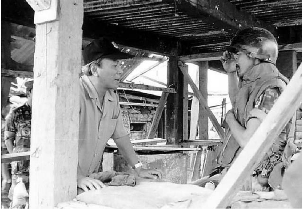
President Nguyen Van Thieu is in a pep talk with a Ranger at Duc Hue Camp