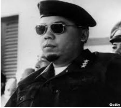
- Tướng Nguyễn Khánh -

Giết chết ông Diệm, nắm được chính quyền rồi thì đám Tướng Lãnh, Sĩ Quan cao cấp lại chẳng biết làm gì cả. Họ chỉ làm được có mỗi một việc là cho mở lại các vũ trường, những chốn ăn chơi đốt tiền, đốt bạc, ăn chơi đĩ điếm. Có thể thôi! Ở các thành phố thì càng thêm rối loạn, mất an ninh, trật tự, tranh giành quyền lực để đưa đến cuộc Chính Lý ( Governmental readjustment ), thực ra là một cuộc đảo chánh khác của Tướng Nguyễn Khánh sau đó không lâu. Ở thôn quê thì coi như bỏ ngõ, mặc cho cộng sản muốn làm chi thì làm vì hệ thống áp chiến lược một công trình xây dựng của ông Nhu, tuy không hoàn hảo, nhưng đã làm cho cộng sản thực sự mất đi một sức mạnh từ cơ sở nông thôn, khó thực hiện được kế hoạch bao vây và tiêu diệt các thành thị của miền Nam . Đầu năm 1963, kẻ viết bài này ( biệt phái ) đã có thể cùng đi với một số sĩ quan và ít binh sĩ võ trang cá nhân đi thăm một số Áp Chiến Lược ( trước đó là vùng cộng sản kiểm soát ) thật an bình, hào lũy chắc chắn, nhân dân tự vệ vững mạnh, dân chúng an tâm làm ăn thoải mái, mà trước kia vùng này cộng sản luôn về thu gom lúa gạo, trâu thuế, tuyển quân ở Quảng Ngãi là vùng đất