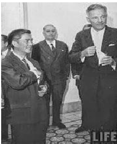
- Cabot Lodge (phải) gặp Ông Nhu -

người cầm quyền khác, biết tuân theo ý muốn của chính quyền Mỹ, đúng ra là giới tài phiệt Mỹ, Ô Kê cho chúng đổ quân tác chiến Mỹ vào Việt Nam, đánh nhau với cộng sản 5, 7 năm thôi. Ai cũng biết mọi tội vạ của vụ đảo chánh này đổ hết lên đầu Cabot Lodge rồi. Nếu Cabot Lodge cho giết ông Diệm, biết đâu lại chẳng có người, mà chắc chắn có người ngay trong số Tướng lãnh và sĩ quan cấp Tá khác, vì xót thương Ông Diệm, vì căm thù Cabot Lodge, vì tự ái dân tộc, mà cho người liều thân, thí mạng, tặng cho Cabot Lodge 1 trái lựu đạn hay 1 quả mìn