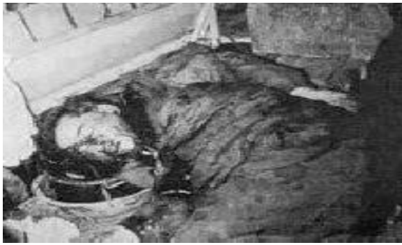
The dead body of Diem in the back of an armoured personnel carrier

Các Tướng đảo chánh liên lạc ngay với Cabot Lodge và bảo đảm với Cabot Lodge là tính mạng của ông Diệm sẽ được an toàn ( At about 6:00 a.m. Diem begins negotiating with the Generals, who have assured that