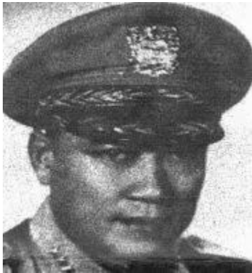
- Tướng Trần Văn Đôn -

B. Cabot Lodge có ra lệnh giết Ông Diệm không ? Cũng không ! Tại sao ? Ngay lúc quân đội đảo chánh đã bao vây chặt chẽ dinh Gia Long, nơi 2 Ông Diệm và Nhu đang ở, Thủy Quân Lục Chiến và nhảy Dù cùng nhiều