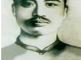
Nguyễn Thái Học

Bộ ( Party cell ) được đưa về Việt Nam gây dựng cơ sở và lực lượng chống Pháp, tạo chính nghĩa (Just cause) cho cuộc đấu tranh lâu dài. Cũng thời gian đó Việt Nam Quốc Dân Đảng ( The Vietnam Nationalist Party ) được thành lập với đường lối chủ trương đối lập hẳn với tổ chức cộng sản nói trên.