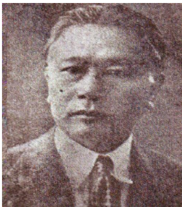
Thủ Tướng Trần Trọng Kim