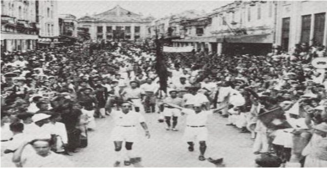
- Cuộc tổng khởi Nghĩa bùng ra ở Hà Nội -

như muốn làm vỡ tung Hà Nội ... Hoa Kỳ thì phân vân, khó xử : không muốn chế độ thuộc địa của Pháp tồn tại, nhưng Hoa Kỳ cũng không muốn Việt Nam rơi vào quỹ đạo của Phong trào cộng sản Quốc Tế, một mối đe dọa còn nguy hiểm hơn cả Phát Xít Đức-Ý-Nhật nữa (... the U.S. Government at this time is in a quandry: not wanting to support French colonialism but not wanting to turn Vietnam over to a communist administration... ), nhưng biết làm sao vào lúc này ?