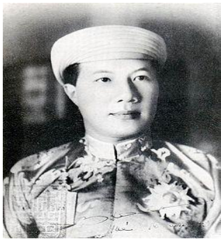
Vua Bảo Đại

Hồ Chí Minh, cán bộ Cộng Sản Quốc tế và lãnh tụ cộng sản Việt Nam sau này, soạn thảo một chương trình 8 điểm cho cuộc đấu tranh giành Độc Lập cho Việt Nam và gửi tới Hội Nghị Hòa Bình nói trên. Nguyễn Ái Quốc tìm gặp Tổng Thống Mỹ Woodrow Wilson ( 1856-1924, vị Tổng Thống thứ 28 của Mỹ, 2 nhiệm kỳ, và được coi là 1 trong những vị Tổng Thống vĩ đại của Hoa Kỳ ) để yêu cầu ủng hộ cho chương trình 8 điểm nói trên, nhưng vị Tổng Thống Mỹ lại muốn Việt Nam đi đến Độc Lập theo chương trình 14 điểm của Ông dành cho tất cả các dân tộc trên thế giới đang bị cai trị bởi một quốc gia khác. Mỹ chống đối chính sách thuộc địa. Thế là mộng ước của Nguyễn Ái Quốc không thành.