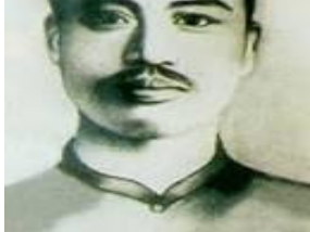
Nguyễn Thái Học

Bộ ( Party cell ) được đưa về Việt Nam gây dựng cơ sở và lực lượng chống Pháp, tạo chính nghĩa (Just cause) cho cuộc đấu tranh lâu dài. Cũng thời gian đó Việt Nam Quốc Dân Đảng ( The Vietnam Nationalist Party ) được thành lập với đường lối chủ trương đối lập hẳn với tổ chức cộng sản nói trên.