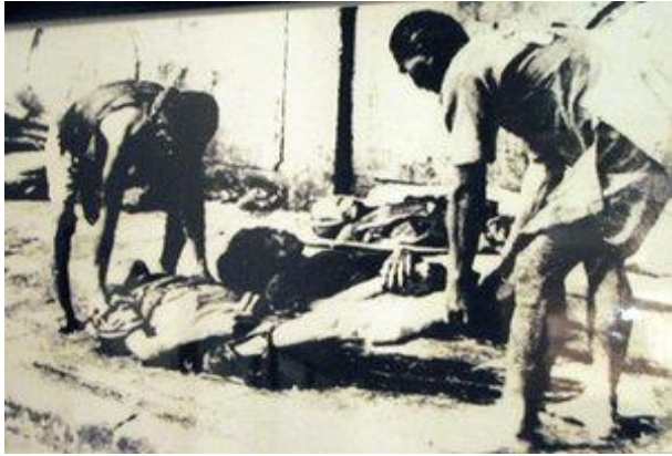
- Người đói không xác kẻ chết đói -

xó chợ, bên vệ đường. Có những người sắp chết vẫn còn cố ráng bút cò, cho vào miệng theo phản xạ sinh tồn ( Surviving reflex ), có những trẻ em thơ dại sắp chết vì đói sữa nhưng vẫn còn ôm cứng người Mẹ, tìm sữa bú trong lúc người Mẹ đã chết cứng từ lúc nào. Kẻ viết bài này hồi đó đang học " Cours Supérieur - Lớp cuối của bậc Tiểu Học thời Pháp ", may mắn vẫn còn được đến trường, nhưng cứ đến sân, trông thấy dăm ba xác chết nằm ở ngay trước hiên, cạnh cửa chính ra vào, lại tàn ngần suy nghĩ vẫn vơ... về cái chuyện " người đói không xác kẻ chết đói " rồi đành quay trở về nhà cho người ta đến dọn dẹp... Lửa căm thù Nhật-Pháp dâng lên ngàn ngọn trong óc, trong lòng người dân Việt Nam Ngay tại nhà tôi, cứ vài ngày, ông anh ruột tôi lại có 1 người bạn cùng lứa tuổi, hoặc là sinh