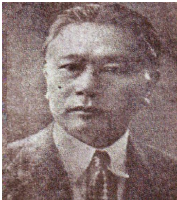
Thủ Tướng Trần Trọng Kim