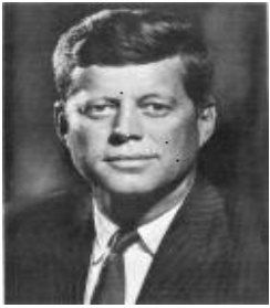
- US President Kennedy -

Ông Kennedy vốn thông minh cho nên đã nhận biết ra điều này cho nên Ông đã từng ra lệnh và nhắc nhở Bộ ngoại giao Mỹ, các nhân vật cao cấp của Mỹ tại Sài Gòn, kể luôn cả Cabot Lodge là " Phải phúc trình ngay cho Tổng Thống biết mọi biến chuyển quan trọng tại Việt Nam thuộc phạm vi trách nhiệm của mình, và mọi quyết định quan trọng đối với tình hình tại đây đều phải có ý kiến trước của Tổng Thống." Lệnh của Tổng Thống là như vậy nhưng các nhân vật cao cấp thuộc Bộ ngoại giao, Cabot Lodge và cấp lãnh đạo CIA ở Sài Gòn có thi hành đúng đắn hay không lại là chuyện khác. Vì tình trạng trên cho nên mặc dầu Cabot Lodge nhận được điện văn khẩn ( Urgent Message ) của Tổng Thống Kennedy yêu cầu liên lạc với các Tướng Lãnh Sài Gòn khoan hãy khởi sự cuộc đảo chánh , nhưng Cabot Lodge chẳng bao giờ thông báo, yêu cầu