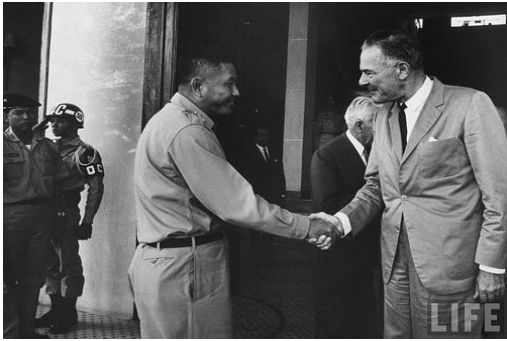
- Big Minh & Cabot Lodge -