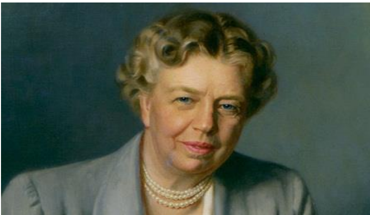
Phu nhân Eleanor Roosevelt được xếp hạng là đệ nhất phu nhân xuất sắc nhất trong lịch sử Hoa kỳ..

Trời không phụ kẻ có lòng và tinh thần tuyệt vời như thế. Ông đã có được Bà vợ hiếm có trên cõi đời này. Bà Anna Eleanor Roosevelt, thay mặt chồng, đi khắp nơi, mọi chôn, đáng lẽ ra Ông Roosevelt phải có mặt để tiếp xúc, hoạt động cho cuộc đời chính trị của Ông. Nhờ đó, sự liên lạc của Ông đối với công việc, với các đoàn thể, các Hội Đoàn không bao giờ bị gián đoạn. Ông tiếp xúc, liên kết được với những khuôn mặt sáng giá của nhiều kinh tế gia, nhà chính trị lỗi lạc là ở chỗ đó. Ông tái đắc cử nhiệm kỳ 2 vào năm 1936, nhiệm kỳ 3 vào năm 1940 và nhiệm kỳ 4 vào năm 1944.