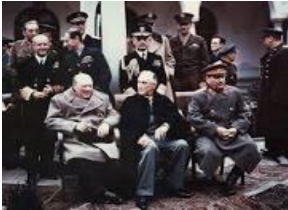
- Summit meeting in Yalta -

Chú. Trong Lịch Sử Hoa Kỳ, đây là vị Đệ Nhất Phu Nhân đầu tiên dám làm công việc nguy hiểm và vô cùng quan trọng đó. Ngày nay, mới có thêm Bà Hillary Clinton được giới truyền thông, báo chí coi là vị Đệ Nhất Phu Nhân và Nữ Chính Trị Gia thứ hai nổi gót, theo Bà Eleanor Roosevelt đi vào con đường nguy hiểm, cần nhiều can đảm, tự tin lớn lao này. Bà Hillary Clinton cũng đã từng tới những vùng chiến trận để thăm viếng, động viên binh sĩ, và gần đây nhất Bà đã tới Afghanistan, rồi Iraq viếng thăm, dùng bữa ăn dã chiến với binh sĩ, khi quanh Bà còn đang tung bừng khói lửa, chiến tranh.