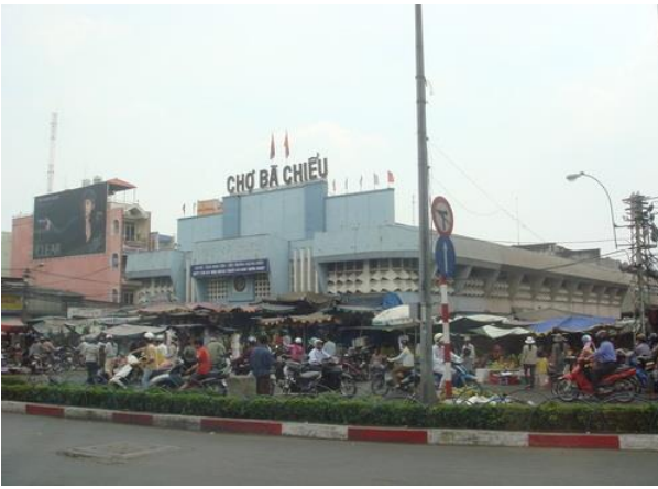
- Chợ Bà Chiểu ở Sài Gòn -