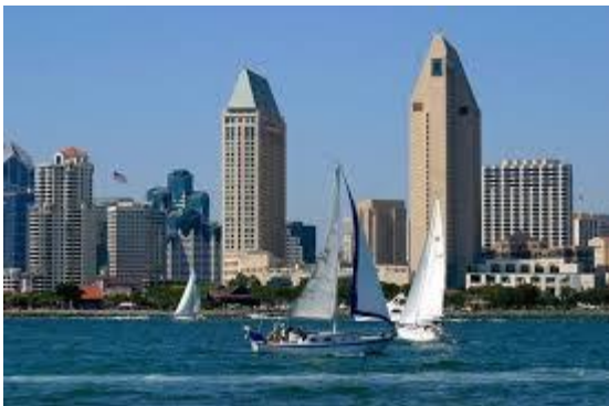
Thành phố San Diego