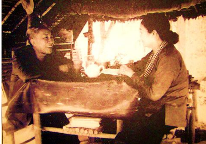
Từ trái Võ Chí Công, Nguyễn Văn Linh* Lê Đức Thọ Nguyễn Thị Định

Trung ương Cục Miền Nam Việt Nam, là một bộ phận của Ban Chấp hành Trung ương đảng Cộng Sản Việt Nam. Là cơ quan chỉ đạo trực tiếp cuộc chiến, đánh chiếm miền Nam Việt Nam.