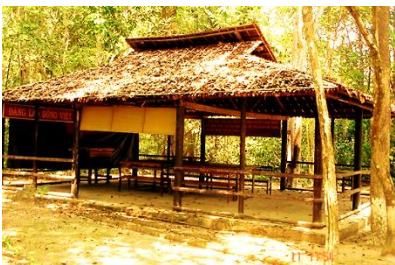
Hội trường Cục R *