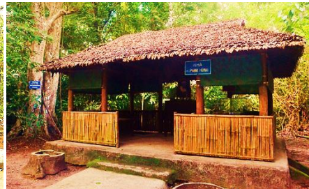
Nhà Phạm Hùng