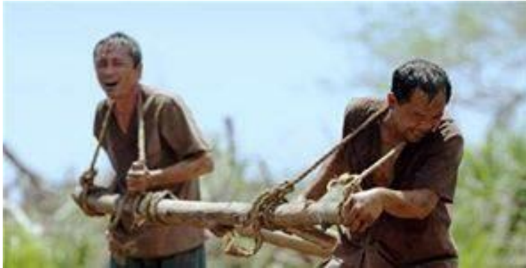
- 2 người tù cải tạo kéo bừa thay trâu -

- Anh thứ nhất: To con, cao lớn, có lòng giúp đỡ bạn bè, khi đi nhỏ sắn, về gần đến cổng trại, anh thường dúm vào gánh của tôi vài củ sắn, cho... đạt chỉ tiêu, nếu tôi cho anh ta biết là gánh sắn của mình coi bộ hơi nhẹ ký, mấy tên công an dám... “giảng bài” quá à... Lại nhớ có một hôm anh em đeo ba-lô đi gửi những mảnh sắt thép tại một địa điểm có vài chiếc xe của quân đội miền Nam cũ phá bỏ, nằm ụ đồng. Công an cho một nhóm tù có tay nghề tới tháo, cưa kéo thành những mảnh nhỏ rồi cho tù tới nhét vô ba lô mà...gửi, mà công về trại để thợ rèn làm thành những con dao đi làm rừng, theo kiểu cán bộ hay thuyết giảng: “ Chế độ của ta vô cùng ưu việt, cái gì cũng làm được hết, biến sỏi đá thành cơm... ” Nhiều anh em từng nói với những bạn tù thân thiết “ Bố khi ! Nước đã có sông, công sức đã có tù thì làm cái chi mà chẳng được. Nếu không có tù thì đổ chúng bay làm được đó! ”. Một bữa đi công sắn vụn về trại, dọc đường hẳn thấy tôi coi bộ muốn... lè lưỡi quá, hẳn bèn ghé sát vào cạnh tôi mà phán: “ Coi bộ ngài Quan tòa nhà ta sắp xum bà chề mắt rồi. Thôi ! Để mình gửi bớt cho một mảnh. ” Nói