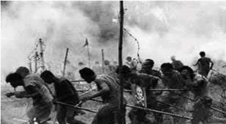
- Tù cái tạo lao động tập thể trên vùng đất mới khai hoang -

Con suối đây rồi! Ba bó mây nằm ba chỗ, chênh vênh trên những mỏm đá. Đồng hồ đeo tay đã bị công an tịch thu khi mới vô trại cho nên tôi không đoán rõ được giờ giấc ra sao, chỉ biết... cố gắng phấn đấu di chuyển từ mỏm đá này sang mỏm đá khác, gom ba bó mây lại, cột chung thành một bó to bự, cột chặt hai đầu, thêm vòng dây cột ở khúc giữa cho chắc ăn. Xong đầu đó, tôi lấy 2 sợi dây rừng lớn hơn, buộc chặt vào vòng dây ở khúc giữa rồi tới vòng dây ở một đầu. Nghỉ một lát lấy sức, tôi thả bó mây bự xuống suối cho dòng nước đẩy đi, tôi chỉ việc giữ cho chắc hai sợi dây rừng để điều chỉnh cho bó mây trôi xuôi theo dòng suối, ra ngoài rừng. Thật là khó khăn, trơn trượt với mấy cái mỏm đá rêu xanh bám đầy, lăm lăm muốn té chết luôn. Có nhiều chỗ tôi phải lội luôn xuống suối, cầm dây hướng dẫn, bó mây mới chịu trôi đi. Nếu không, nó sẽ mắc cứng ở mấy cái chỗ khúc khuỷu, quanh co, lồi lõm những mỏm đá ác ôn, mất dây.