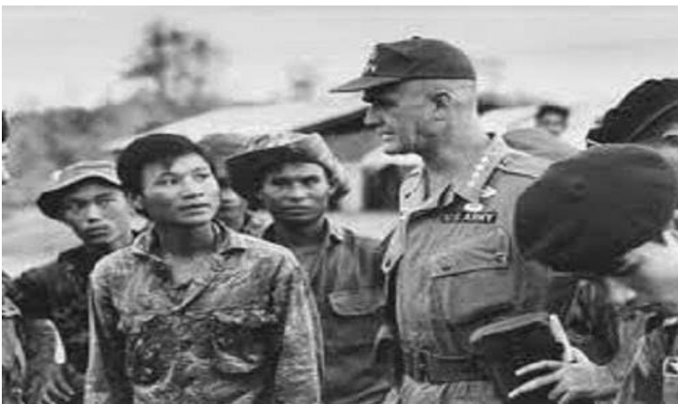
General William C. Westmoreland:

* Điểm nữa, cũng ảnh hưởng rất nhiều đến tinh thần, thể chất, tâm lý của người chiến binh Việt Nam là: trong khi mình xả thân chiến đấu bảo vệ đất nước, bảo vệ mạng sống của chính mình thì lúc đó gia đình, những người thân yêu phải sống ra sao ? Liệu có đang kẹt trong vùng lửa đạn, chết chóc hay không ? Về điểm này, người chiến binh Hoa Kỳ khỏe hơn là cái chắc, tinh thần ổn định, thoải mái hơn rõ ràng. Bây giờ, nếu đặt người chiến binh của các cường quốc Âu-Mỹ vào vị trí, hoàn cảnh chiến đấu khó khăn, thiếu thốn, khắc nghiệt của người chiến binh Việt Nam Cộng Hòa, thử hỏi liệu những người chiến binh ấy có thể chiến đấu được như người chiến binh Việt Nam Cộng Hòa hay không ? Chịu được bao lâu ? Chính Phủ, Quốc Hội và Nhân Dân các quốc gia đó chịu được mấy tháng, mấy năm?